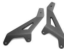
Basisaufnahme für die Sissybar XV950