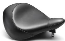
Einzelsitz für geringeren Sitz-Lenkerabstand XV950